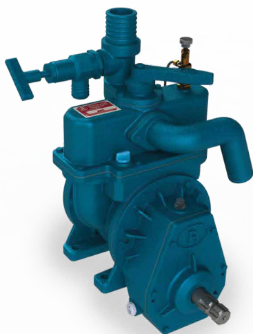
NAV 180 WA