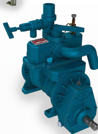
NAV 300 WA

Imagens deste material são meramente ilustrativas